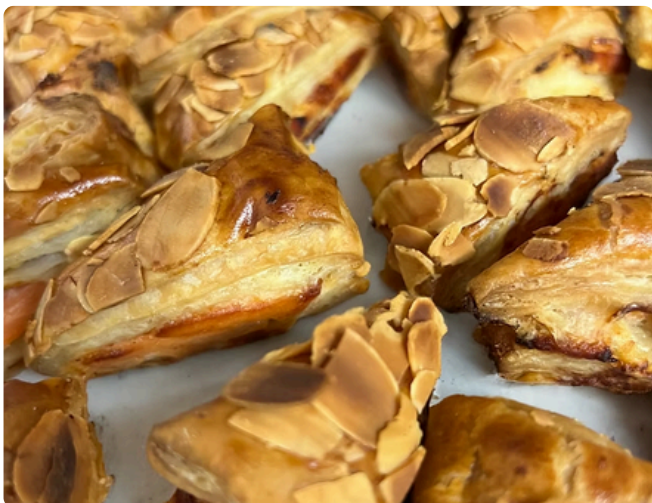
Triangle au saumon