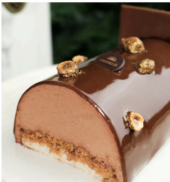
LA ROYALE CHOCOLAT