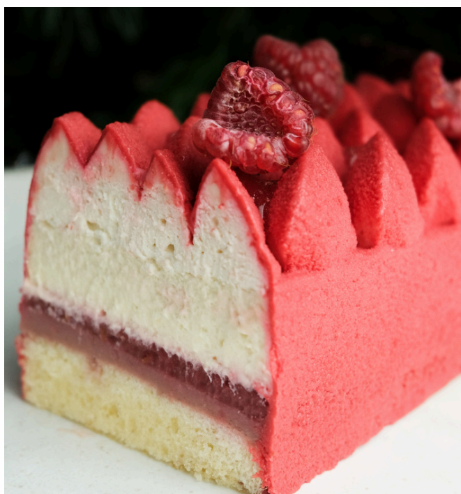
LA FRAMBOISE VERVEINE