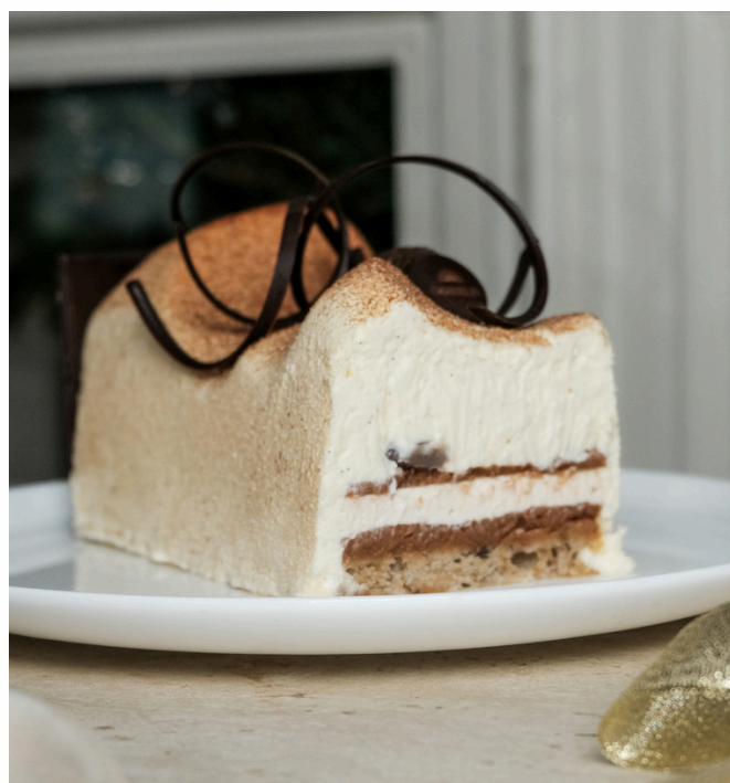
LA MARRON VANILLE