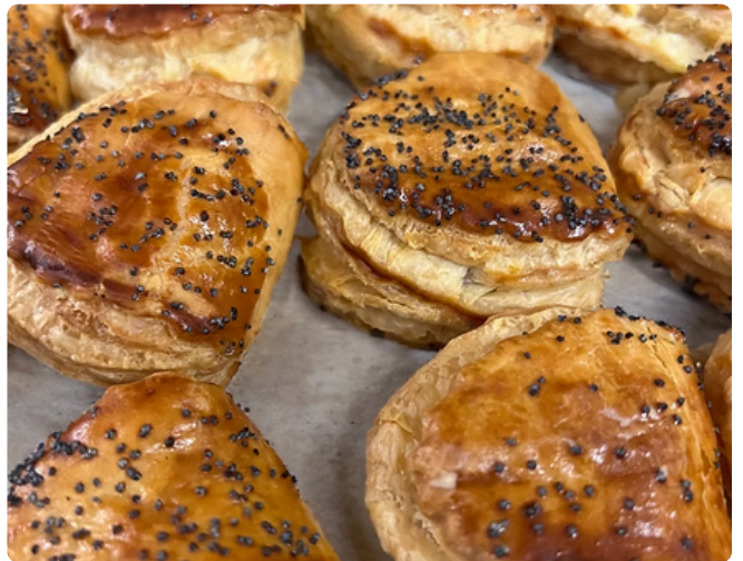
Chausson au thon