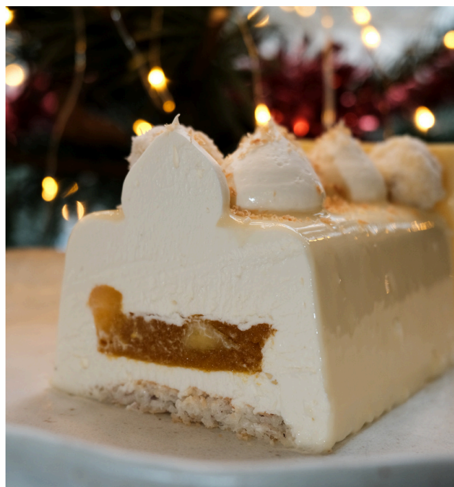
LA COCO MANGUE